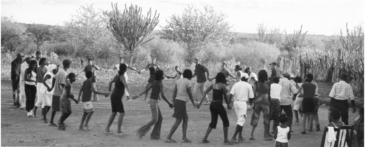
Foto: Proyecto GEOAFRO-CIGA-UNB, Populación Quilombola, Queimada Nova, Piauí, Brasil. 2006